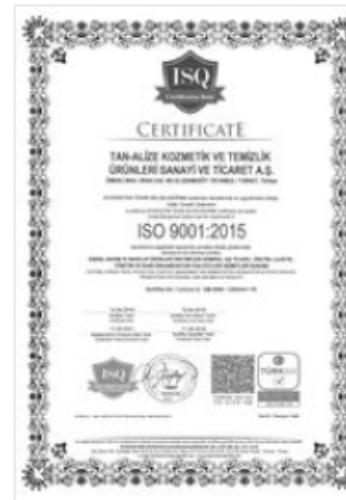
ISO 9001 Certificate