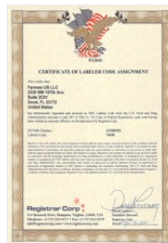
Certificate of Labeler Code Assignment