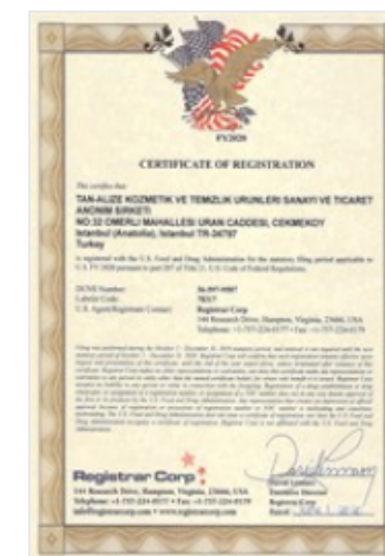
Certificate of Drug Establishment Registration