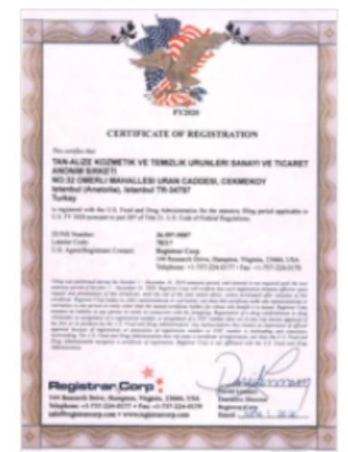
FDA Plant Certificate Of Registration