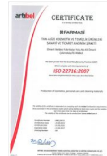
GMP ISO Certificate